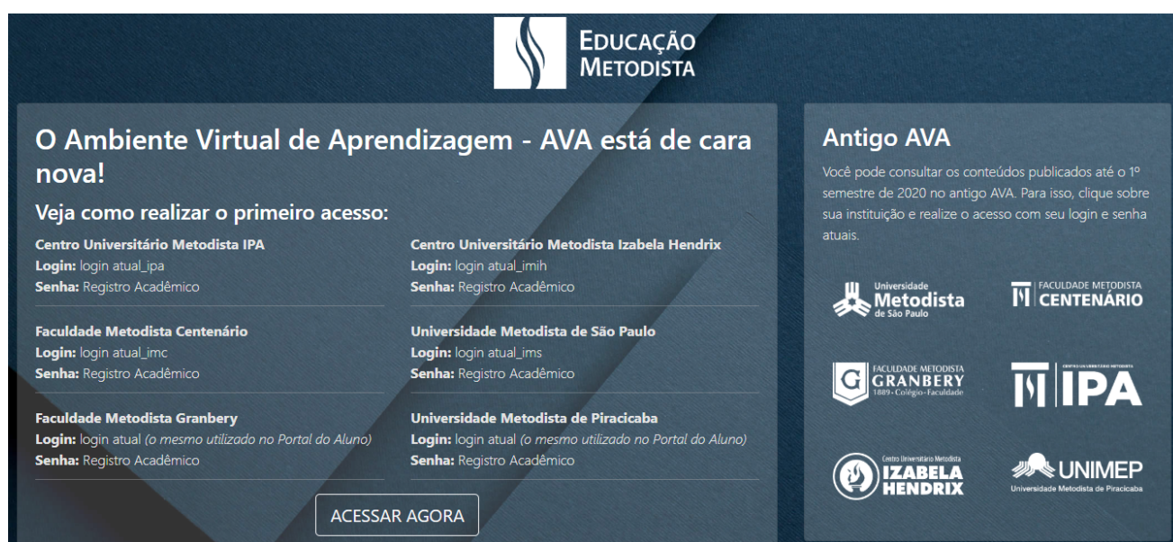
Figura 1: Página Educação Metodista

Ao Acessar o Moodle você será direcionado para a página principal da Educação Metodista.